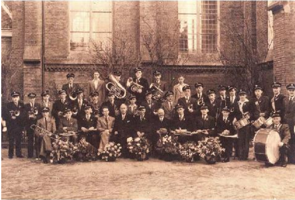
Archieffoto van 'Ons Genoegen'.

Om daar bij stil te staan houdt SCEG in samenwerking met een aantal oud-leden van het korps op vrijdag 21 april een publieksavond. Deze staat geheel in het teken van het voormalige fanfarekorps en de drumband.