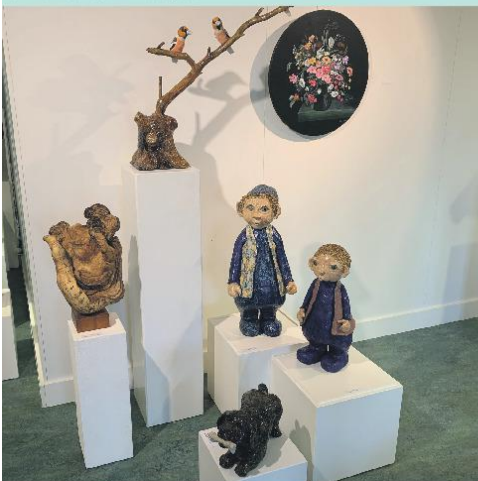
Een bescheiden indruk van de grote variatie die te zien is op de expositie 'Wat een verbeelding!'

Training start op 16 maart – Opgeven kan tot 9 maart