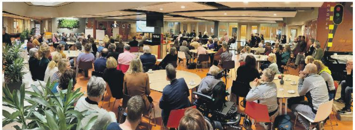
Veel betrokkenen én belangstellenden bij de aftrap van 'Gezond en Gelukkig Zwartewaterland'.

De vraag naar zorg en ondersteuning neemt toe. Net als de vergrijzing, arbeidstekorten, inflatie en stijgende (zorg)kosten. Dit zet de houdbaarheid van de zorg en ondersteuning onder druk. Daarom is investeren in preventie en gezondheidsbevordering belangrijk. Om op deze ontwikkeling te anticiperen ondertekenden onlangs bijna 50 organisaties en verenigingen het Preventieakkoord van Zwartewaterland. Om de aanpak herkenbaar te maken is een permanente en herkenbare campagne ontwikkeld, met de naam Gezond en Gelukkig Zwartewaterland.