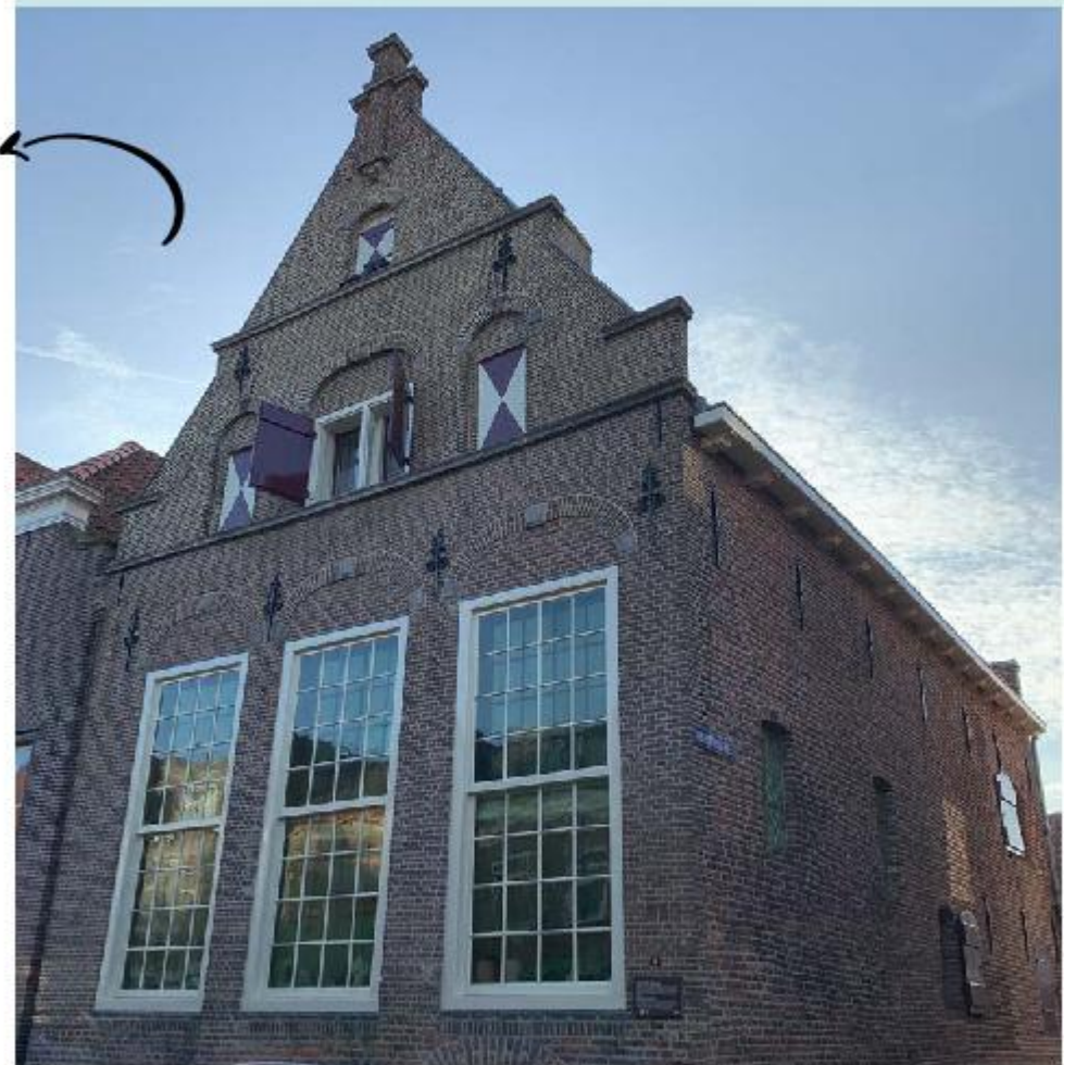
Het geboortehuis van Kiliaen van Rensselaer krijgt een nog grotere historische betekenis.

Ook een ander aspect van de geschiedenis van de locatie aan de Hoogstraat gaat uitgelicht worden. The Vanneau Foundation wil namelijk een deel van het gebouw ook inrichten voor een tentoonstelling over Peregrinus van Barmantlo. Hij was in 1481 één van de allereerste boekdrukkers in Nederland. Voldoende aanleiding voor The Vanneau Foundation om ook daarover een permanente tentoonstelling in te richten. De drukkerij stond op dezelfde plek als het huidige pand aan de Hoogstraat 12.