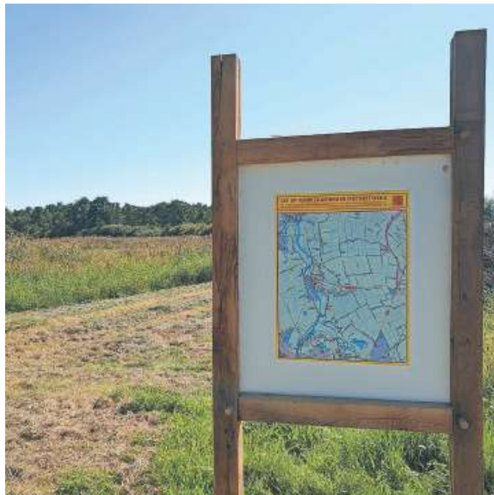
Fietsers worden met publicaties op de routeborden geïnformeerd over de werkzaamheden.