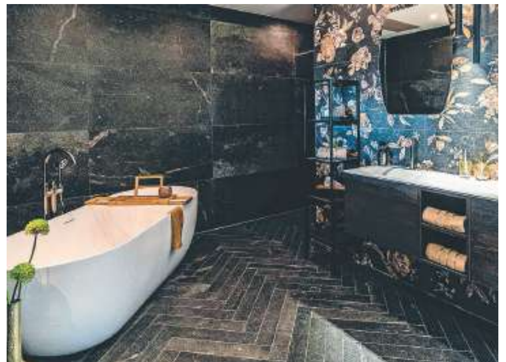
Een inblik in de ruime showroom van Broekhuizen Keukens en Sanitair

Maandag t/m vrijdag van 9.00 tot 17.30 uur Zaterdag van 10.00 tot 16.00 uur