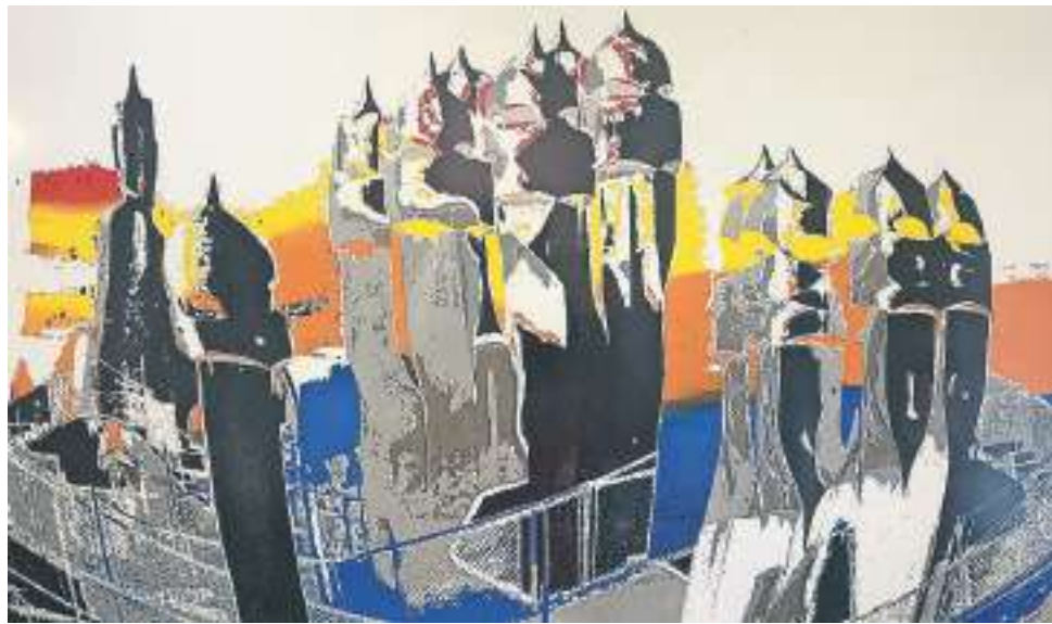
Op de nieuwe wisselexpositie van Museum Schoonewelle is onder meer dit kleurrijke werk van Trees van Es te zien.