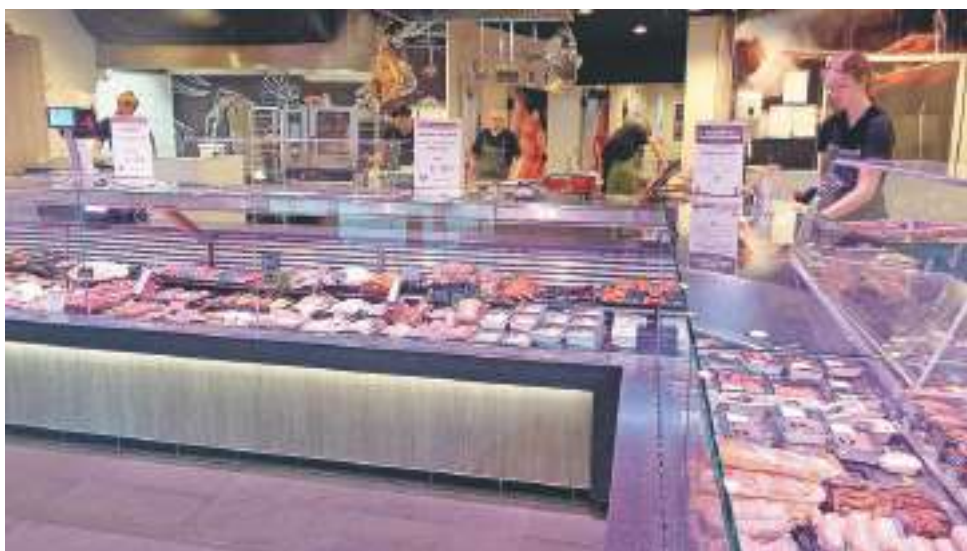
Natuurlijk ligt er veel vlees in de vitrines bij Gildeslager Van Ingen, maar ook heel veel andere lekkere producten zijn te verkrijgen.

Gildeslager Van Ingen Havenplein 3c 8281 EV Genemuiden Telefoon (038) 3855113 Internet www.slagerijvaningen.nl info@slagerijvaningen.nl