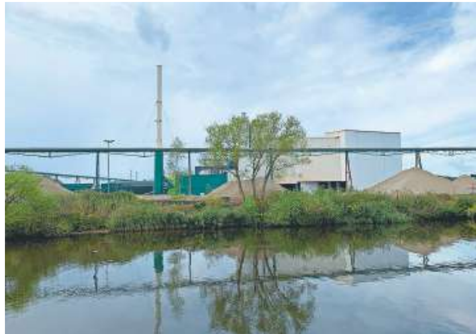
Schagen Infra bestaat ruim zeventig jaar en is al sinds 1961 in Hasselt gevestigd. Op deze foto is een deel van het bedrijf te zien vanaf het Zwarte Water.

In de moderne (elektrische) vrachtwagens is te ervaren wat een dode hoek precies is en