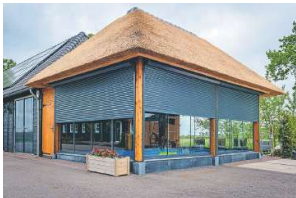
Voor alle soorten zonweringen kun je terecht bij Sanson Zonwering in Genemuiden

En daarbij krijg je door mijn boekhoudkundige achtergrond duidelijke communicatie, de zaken helder op papier. Discussie achteraf, over garantie of andere zaken, wordt zo voorkomen. De levering is ook snel, meestal binnen zo'n drie weken, terwijl dat elders normaliter acht tot wel tien weken is."