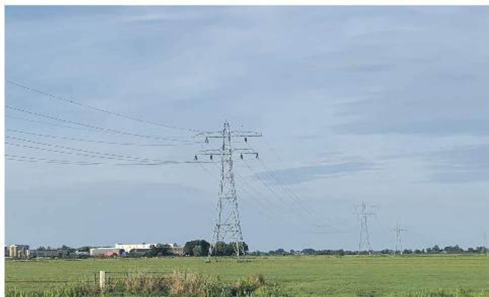
Plannen om vijf, ruim 200 meter hoge, windmolens aan de rand van het industriegebied van Zwartsluis te plaatsen leidden deze zomer tot een stevige protestactie.

Of de gemeenteraad hiermee heeft ingestemd, is ondertussen bekend en te lezen op de site van de gemeente.