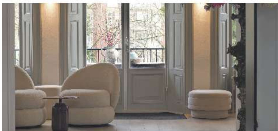
De sfeervolle en uitnodigende lounge van House of Joy & Health.

In Zwolle gaat Joy & Health ook inhoud geven aan een nieuw onderdeel van het bedrijf. Een ruimte op de eerste verdieping van het pand in hartje Zwolle biedt plaats aan een opleidingsinstituut voor meerdere doelgroepen. Vooral voor huidverzorging, maar daarnaast voor ondernemers in het algemeen en in de schoonheidsbranche in het bijzonder.