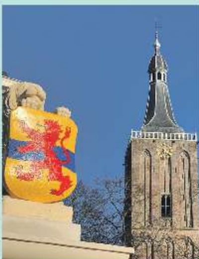
Fier kijken de leeuwen uit over de binnenstad van Hasselt.