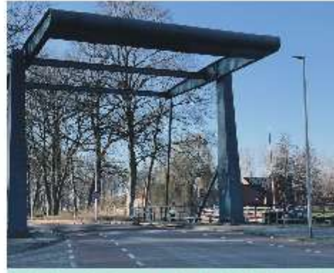
Ook de ophaalbrug in de dr. H.A.W. van der Vechtlaan in Hasselt is aangeduid als gemeentelijk monument.

Zwartewaterland telt 42 gemeentelijke monumenten. Eigenaars van zo'n gemeentelijk monument kunnen ook dit jaar weer gebruikmaken van een financiële bijdrage van de gemeente Zwartewaterland. "Het historische karakter van onze kernen en het buitengebied is van grote meerwaarde voor bewoners en bezoekers. Daarom reserveren we elk jaar een bedrag waarmee we woningeigenaren ondersteunen bij het onderhoud van hun monumenten", aldus wethouder Harrie Rietman. De gemeente heeft hiervoor in 2023 een bedrag van 30.000 euro beschikbaar.