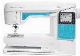
Husqvarna Viking Model Opal 650

Op vrijdag 14 en zaterdag 15 april demonstratie dagen van Babylock – Lockmachines en coverlocks.