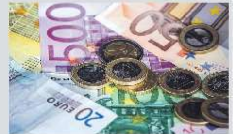
Het Sociaal Noodfonds is er voor wie net iets meer verdient en toch hulp nodig heeft.

Kijk voor meer informatie op www.zwartewaterland.nl/hoge-energierekening .