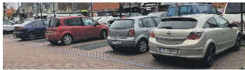
Hoewel de raad vooral stilstond bij de parkeerproblemen in de centra van Hasselt en Genemuiden, blijkt voor Zwartsluis dat met name binnen de 'blauwe zone' veel langdurig wordt geparkeerd. Alleen handhaving kan dit ondervangen.

Vrijwel alle raadsleden konden zich vinden in