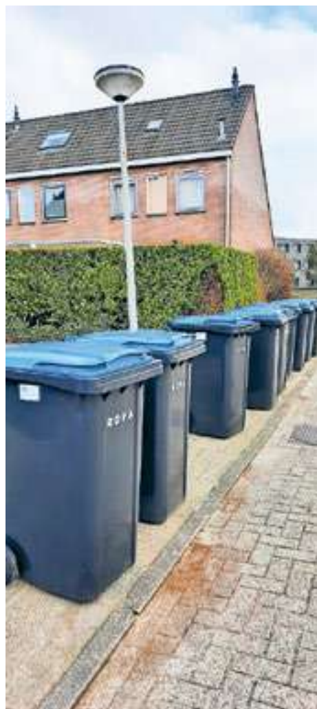
De nieuwe papiercontainers staan klaar voor de ROVA.

Meer informatie nodig over het scheiden van afval of iets te melden? Ga dan naar www.steenwijkerland.nl of bel naar het ROVA Klantcontactcentrum: (038) 4273777.