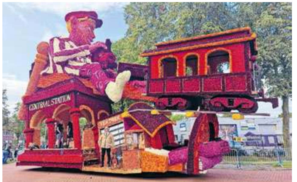
Twee Nijenhuisen wint ereprijs met ontwerp ‘Droombaan’ (2023).

Richard krist | 06-48415584 | info@rk-uitvaart.com | www.rk-uitvaart.com ..