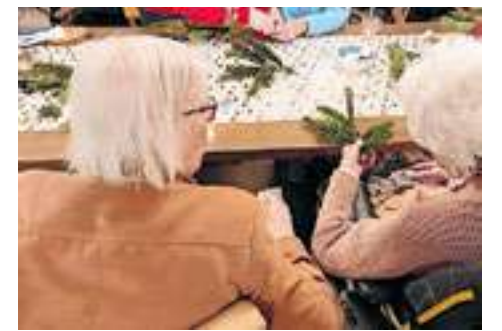
mv Korsel en mv Van den Heuvel, aan het kerst-knutselen.

Na het rustmoment keren bewoners naar de keuken en huiskamers voor een gezellig samenzijn, kopje koffie, een activiteit of ze krijgen visite. Bij mooi weer gaan we er veel op uit om te wandelen. De kapster, pedicure