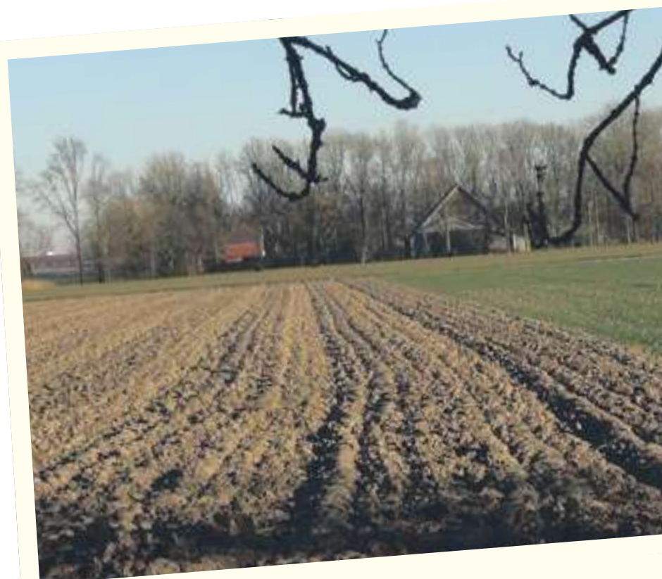
Landerijen in winterrust

Nu hadden we bericht gehad dat de Goedheiligman ons al op zondag een bezoek ging brengen en we zouden daarvoor bij één van de kinderen op bezoek gaan op zondag rond half elf. De zondagsrust heb ik deze keer maar genegeerd en bij het eerste licht om 8 uur zat ik weer op de trekker. Ik zag dat de burens verderop ook weer bezig waren. Het lukte me maar niet om er achter te komen waar ze nu mee bezig waren. Ik zag wel dat er bulten gestort werden maar dan konden het nog steeds bieten of witlof zijn. Ik had de oplossing om er achter te komen. Als we straks naar Emmeloord gaan neem ik een andere route zodat ik kan zien wat daar ligt! Verder ploegen tot tien uur, en snel naar huis. Omkleden en rijdend langs de mysterieuze bulten blijken het toch bieten te zijn. Ze liggen er waarachtig nog redelijk schoon bij. Verder geheel "ontspannen" de Sinterklaasviering uitgezeten. Om twee uur weer op het land. Ik had mijn vrouw al verteld dat ik alleen thuis kom als het te hard ging sneeuwen. Intussen probeerde ik uit te rekenen hoe lang ik werk zou hebben om het achterste perceel klaar te krijgen. Het zou net moeten lukken voordat het donker is. Dat zou mooi uit komen, want het is lastig om in het donker een mooie aansluiting te krijgen met het tarwe perceel. Net op tijd. En prima gelukt.