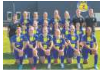
d'Olde Veste '54 22