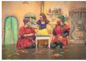
Theater de Meenthe 18