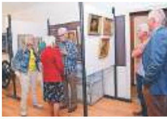
Schilderijen Jan Katers 11