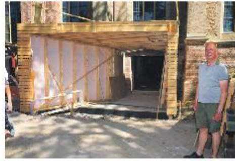
Wim Hultink bij de nieuwe ingang van de kerk waarvan de contouren al goed zichtbaar zijn.

STEENWIJK - Geklop van hamers, lawaai van boommachines en cirkelzagen zagen houten panelen perfect op maat. Buiten staan nieuwe ruiten te wachten op een plaatsje in de ruimtes die binnen in de Sint Clemenskerk worden gecreëerd. 'Zoals je ziet zijn we hier nog knap aan het buffelen om de boel klaar te krijgen', zegt projectleider Wim Hultink. De grootse renovatie in eeuwen van misschien wel het fraaiste kroonjuweel van Steenwijk loopt om meerdere redenen vertraging op.