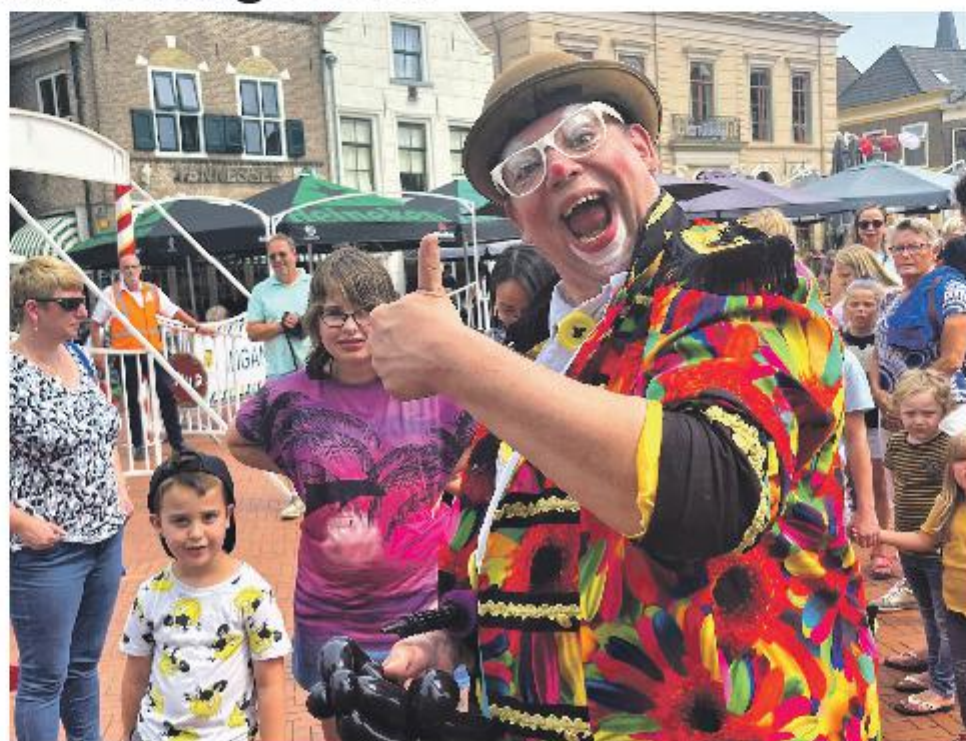
Circus in de stad!

Op woensdag 10 augustus is het Foodtruck Festival met Blues op de Markt te vinden, tussen 11.00 en