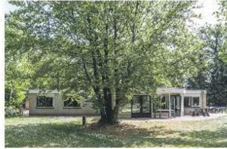
De Eikenhorst heeft twee hectare eigen bosrijke grond.

DE BULT - Konijntjes huppelen door het gras. Spechten tikken met hun snavels in het schors van de bomen, en eekhoortjes rennen in volle vaart een beuk in. Een orkest van kikkers zit vrolijk te kwaken in de vijver. Een reiger zit zijn kans af te wachten om in een ongezien ogenblik één van de groene vrolijke muzikanten het zwijgen op te leggen en daarna te verorberen.