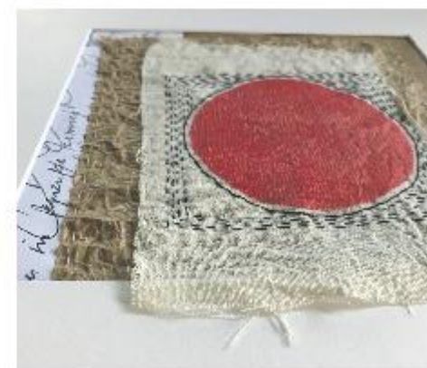
Op de foto werk van Helma Lok-Hörnemann.

Kunst & Kerkje zijn beiden de moeite waard om te bezoeken. 'Verandering' is te zien van 30 juli t/m 14 augustus in het doopsgezinde kerkje 't Lam, Breestraat 2, Blokzijl. De expositie is dagelijks te bezoeken van 11.00 - 17.00 uur.