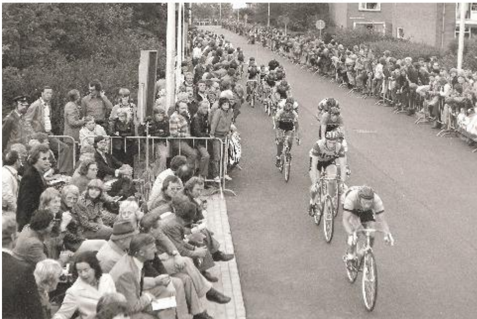
De eerste profkoers in 1974 met start en finish aan de Zigher ter Steghestraat.