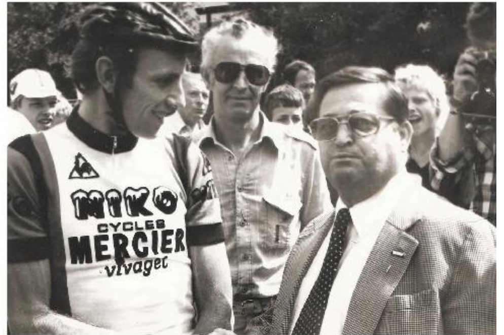
Willy Alberti te gast in Steenwijk, hier samen met Joop Zoetemelk.