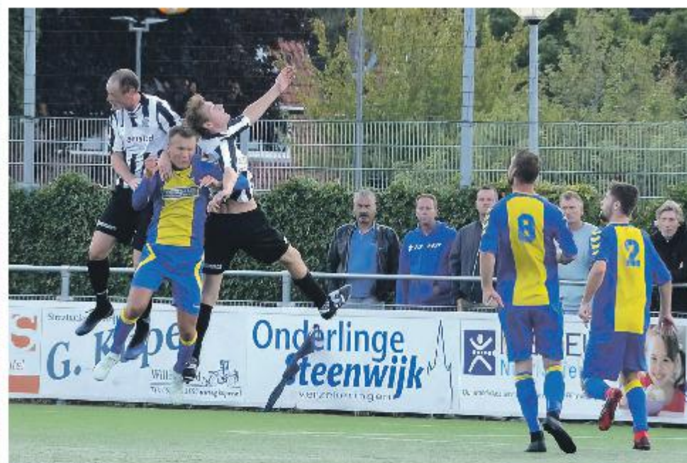
een foto uit het OV-archief, spelmoment uit MSC-OV, gemaakt door Jacob Westra.

Ook Olde Veste draaide afgelopen seizoen mee aan de kop van de reserve hoofdklasse. Naast het tweetal clubs komt ook MSC weer naar Steenwijk. De ploeg werd afgelopen seizoen kampioen in de vijfde klasse en staat voor het aanstaande voetbaljaar onder leiding van trainer Guido Wind. Als vierde ploeg in de deelnemerslijst staat het talententeam van SVI (O23) te boek. De vier ploegen zullen hun toernooi starten op woensdag 17 augustus terwijl ze ook op de finaledag in actie zullen komen.