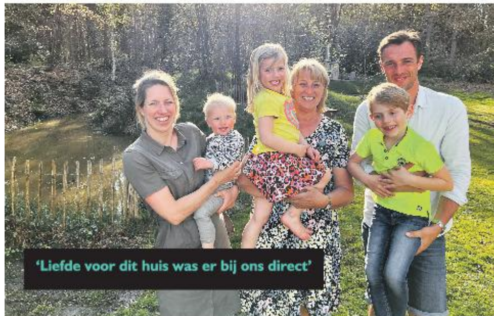
'Liefde voor dit huys was er bij ons direct'