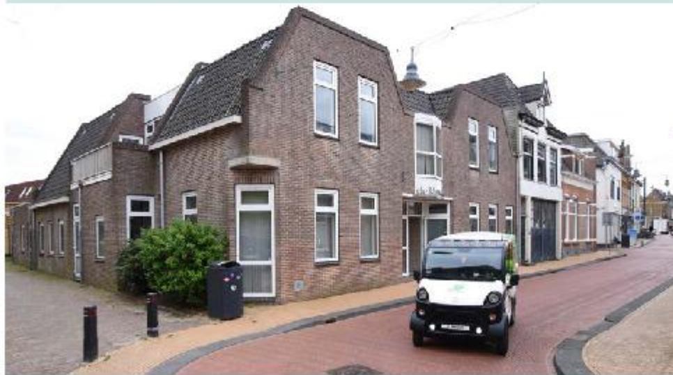
Gebouw de Klincke aan de Kerkstraat.

de Sint Clemenskerk, die recent is afgerond." Brus spreekt bewust van 'panden'. "Want de verkoop van het naast de Klincke gelegen Pand Zoer is ook zo goed als rond." Esther Zoer koopt het voormalige pand van haar opa terug van de protestantse gemeente. "Ze gaat op de bovenverdieping wonen, en de ruimte beneden wordt onder meer gebruikt om workshops te houden en als hobbyruimte."