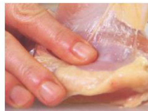
Een voorbeeld van hoe bindweefsel eruit ziet

Informeer telefonisch vrijblijvend naar de mogelijkheden voor uw klacht(en) bij Roelie Vijverberg tel. 06-15449378.