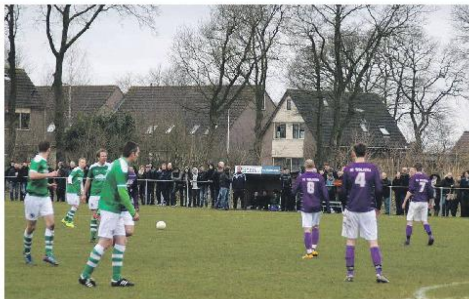
Nieuwe spelers kunnen zich melden!