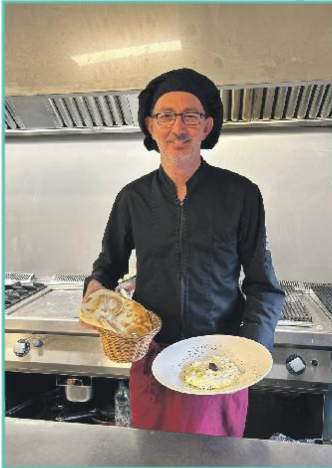
De chef-kok dient een lekkere tzatziki op.

Alles wederom even goed mengen en uw eigen gemaakte frisse tzatziki is klaar.