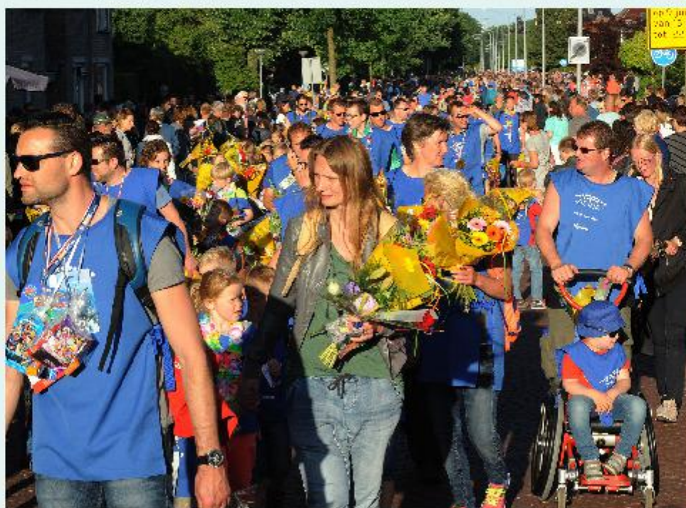
De jaarlijkse Avondvierdaagse is het grootste volksfeest van Steenwijk.

Achteraf gezien is voor wat de muzikale omlijsting betreft de periode van 5 tot en met 8 juni niet zo gelukkig gekozen. "Want Kampen, Emmeloord en Zwolle hebben dan ook een avondvierdaagse. De korpsen uit die plaatsen lopen het liefst in de eigen stad. In onze eigen regio is sprake van vergrijzing. Gevolg daarvan is dat muzikanten nog wel zittend willen optreden, maar niet meer de conditie hebben om mee te lopen." Positieve uitzondering daarop is Vollenhoofsch Fanfare. "Die komen al sinds jaar en dag op dinsdagavond." Het muziekprogramma is nog niet helemaal rond. "Maar we zijn wel al een heel eind hoor. Soli Deo Gloria uit Sint Jansklooster; Crescendo Steenwijk en andere muzikanten willen zittend optreden op maandagavond. Dan komt ook Melody & Percussion Band Euphonia uit Wommels naar de vierdaagse." Ook voor woensdagavond ligt al het een en ander vast. "Ter hoogte van Dynasty aan het Steenwijkerdiep staat dan draaiorgel Grote Dorus uit Wolvega. Ook muziekkorps Excelsior uit het Drentse Oosterhesselen komt dan naar Steenwijk." De slotavond is nog een puzzel. "Draaiorgel de Parel uit Meppel zorgt voor vrolijke muziek aan de Meppelerweg. En Top Onna zit op de locatie van de Ford Garage. Ook de muzikanten van de Lowland Brigade Pipe Band Zwolle lopen mee met de wandelaars. En daar komt nog wel wat bij. Over het slotoptreden zijn we nog in gesprek. De komende weken zal hierover meer duidelijk worden."