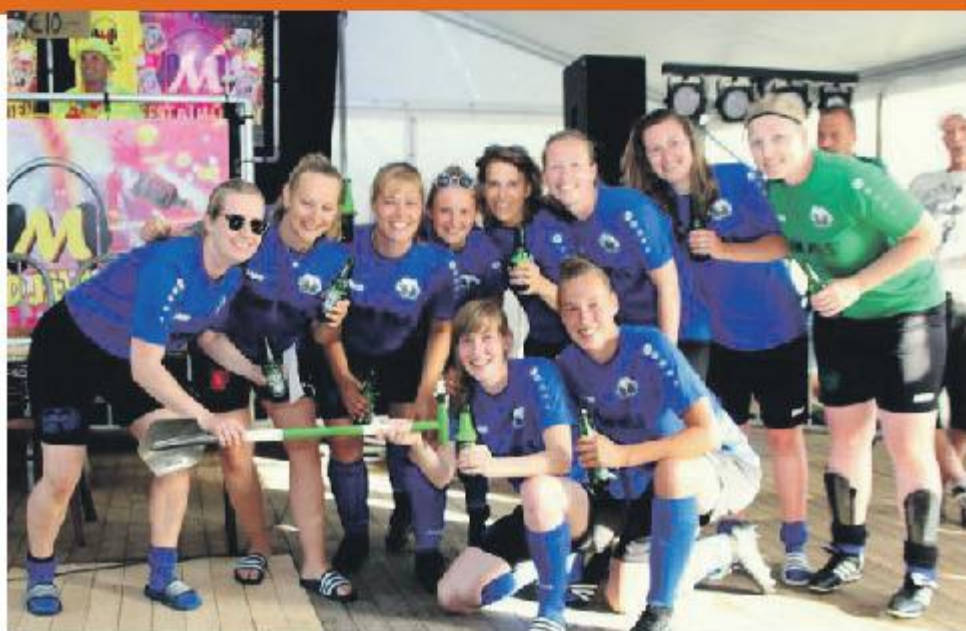
Titelverdediger bij de dames Team Bier zal ook dit jaar present zijn.

Naast het voetballende gedeelte is het avondprogramma ook altijd helemaal top. "We mogen wel zeggen dat we daarmee in de roos geschoten hebben en ook dit jaar hebben we met DJ Fox weer een feestklapper kunnen binnenhalen", lacht het tweetal. Nieuw dit jaar is dat er tijdens de laatste wedstrijden ook al muziek in de grote feesttent zal zijn. "Tijdens de slotfase van het toernooi wilden we wat meer leven in de brouwerij, dus gaan we proberen om via twee dj's extra sfeer te creëren." Momenteel zijn Alberto Schipper en Maarten van Wolde de laatste puntjes op de bekende i aan het