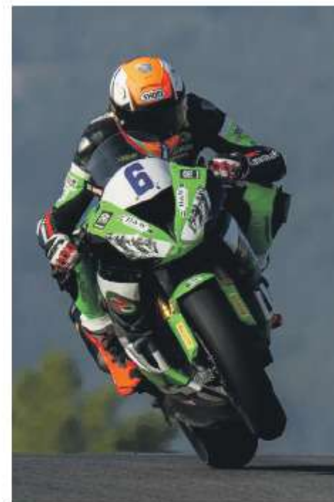
De zwaardere 600 Kawasaki maakt straks weer plaats voor een tweewieler in de 300 klasse.

De racekalender voor de World Supersport 300 klasse is voor 2023 grotendeels al bekend. Zoals gezegd zijn de eerste twee races op het circuit van Assen op 22 en 23 april. Op de vrijdag ervoor zijn er trainingen en kwalificaties. De raceweekenden die volgen, bestaan ook steeds uit twee races waarin WK punten verdiend kunnen worden. Op 6 en 7 mei zijn er races op het circuit van Barcelona-Catalunya. Daarna wordt er op 3 en 4 juni gereden op Italiaanse bodem. Het Misano World Circuit Marco Simoncelli. Augustus is een vakantie maand. Eind juli staat er echter nog wel een raceweekend gepland, op 29 en 30 juli op Autodrom Most in Tsjechië. In september wordt de draad, oftewel de racekalender, weer opgepakt. In het tweede weekend van september, 9 en 10 september, vertoeven de coureurs in Frankrijk op het Circuit de Nevers Magny-Cours. September wordt sowieso een drukke maand voor de motorcoureurs in deze klasse. Want twee weken later strijken de sportmensen neer in Spanje. Op 23 en 24 september zijn er races op