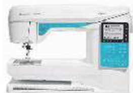
Husqvarna Viking Model Opal 650

Op vrijdag 14 en zaterdag 15 april demonstratie dagen van Babylock - Lockmachines en coverlocks.