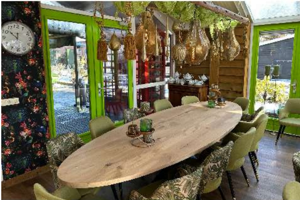
'het nieuwe interieur van de theeschenkerij op de Maargies Hoeve'.

Een week lang is er met man en macht gewerkt om alles binnen de gestelde tijd af te krijgen en het resultaat is ernaar. Al met al voldoende redenen om langs te komen op 16 april. De entree is gratis en de markt duurt van 10.00 tot 17.00 uur. Adres: Kallenkote 19 in Kallenkote. Meer informatie is te vinden op de website: www.demaargieshoeve.nl