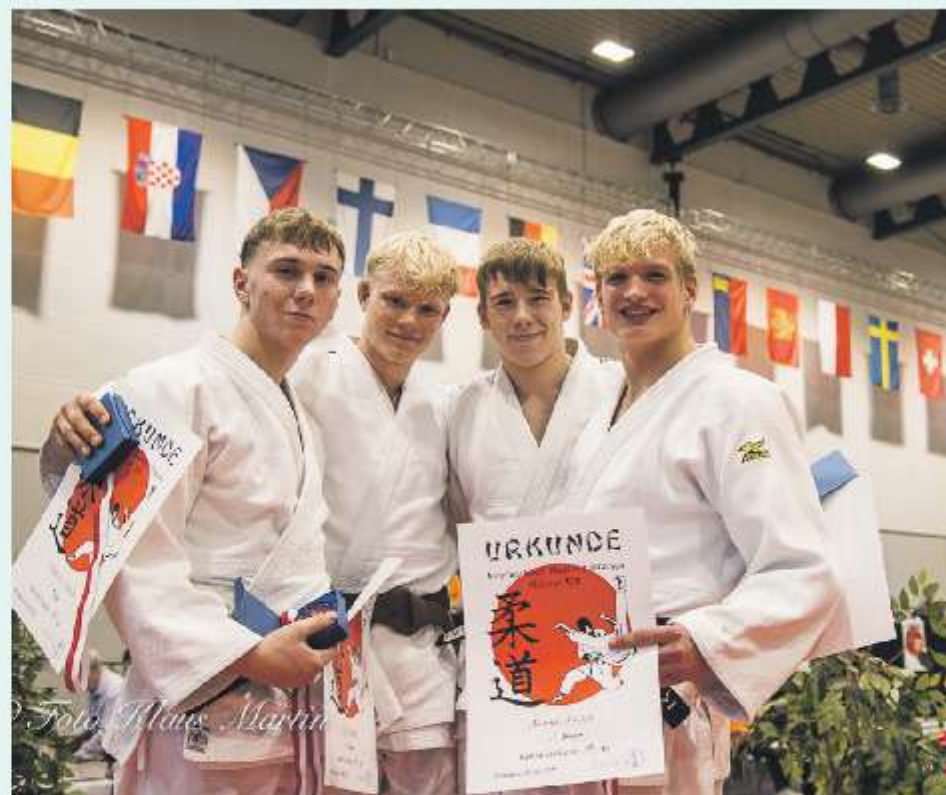
De blonde judoka, tweede van links, op het hoogste treetje van het podium van de prestigieuze Bremen Masters.