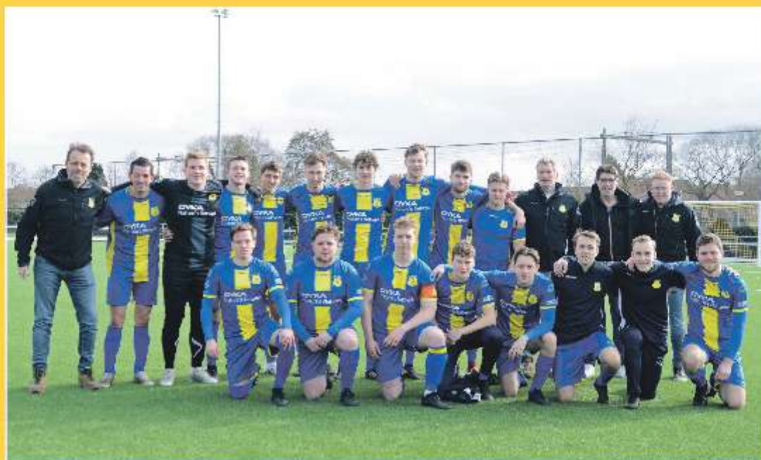
Het derde seniorenelftal toont de nieuwe tenues.

Met een overwinning op zak tegen Balk, FC Meppel, Workum en Sneek Wit Zwart lijkt het team op weg naar een nieuwe promotie. Voor de camera van Jacob Westra werd er geposeerd waarbij de nieuwe outfit de ploeg een keurige uitstraling geeft.