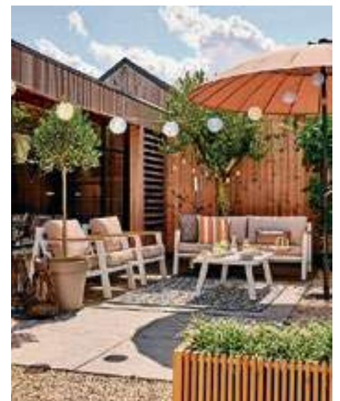
De Modern Luxury Stijl.