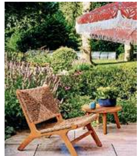
Landelijk meets Rebel.

Zomerbloeiërs | Ga voor een sierlijk terras met zomerbloeiërs en geniet de hele zomer van prachtige kleurrijke bloemen. Is er een bloem uitgebloeid? Geen probleem, haal deze wel even weg, zo wordt de groei van nieuw bloemen gestimuleerd. En vergeet vooral niet om genoeg water te geven.