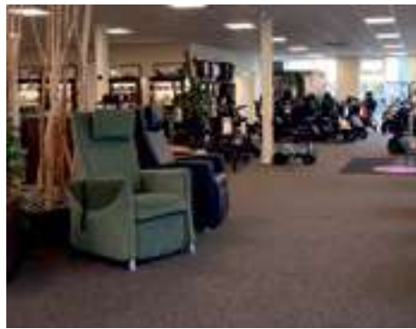
Een bezoek aan de showroom in Emmeloord is eigenlijk een beleving. En slaag je hier niet, bij een van de grootste zorgwinkels van het land? Dan waarschijnlijk nergens

Chalong de Bruin wijst op de scootmobiel. "Dat zijn natuurlijk best forse apparaten. En dat kan onhandig zijn als je ze in de auto wilt vervoeren voor bijvoorbeeld een dagje de natuur in of winkelen in de stad. Maar daar is een oplossing voor. Wij hebben kleine demontabele scootmobiel. Die bestaan uit vijf losse delen die gemakkelijk uit elkaar zijn te halen en weer in elkaar gezet kunnen worden. Een stuk flexibeler te vervoeren dus. En met minder zwaar sjouwen: de scootmobiel hoeft niet meer in zijn geheel opgetild te worden." Ook op het gebied van rollators is Maxvitaal er als de kippen bij als er een vernieuwend product op de markt komt. "De meeste wat oudere rollators zijn zwaar, dat kan zelfs oplopen tot zo'n kleine twintig kilo. Ook dat kan hinderlijk zijn, zeker als je de rollator ergens naartoe moet dragen. Hier hebben we rollators van carbonfiber die maar zo'n vijf kilo wegen. Of die wel dezelfde stevigheid bieden als de stalen exemplaren? Jazeker. Carbonfiber wordt ook gebruikt in bijvoorbeeld racefietsen. Je kunt je voorstellen dat het dan wel een heel stevig materiaal moet zijn dat ook tegen een stootje kan. En dat is het