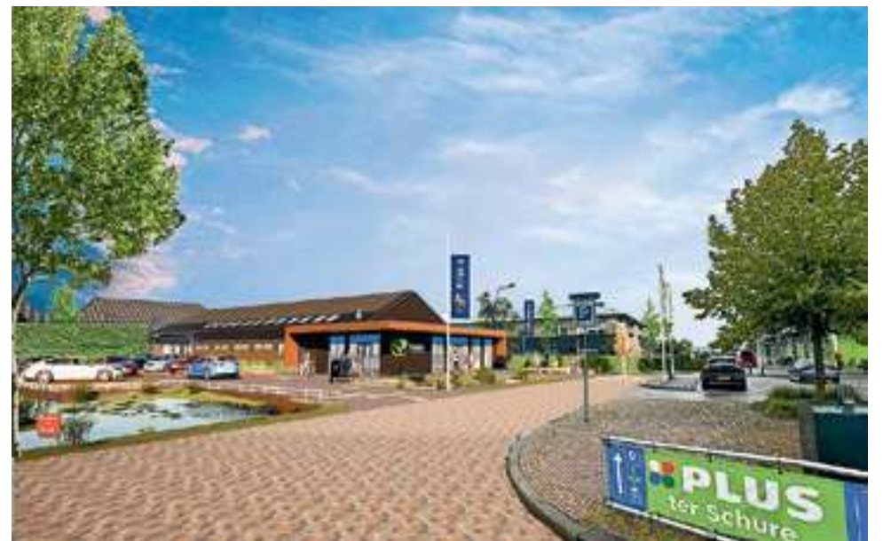
De Primera in Giethoorn zoals die eruit gaat zien.