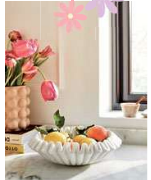
Organische vormen zijn eyecatchers in je interieur.

We gaan in dit artikel op een paar van deze voorjaarstrends in. Welke is jouw favoriet?