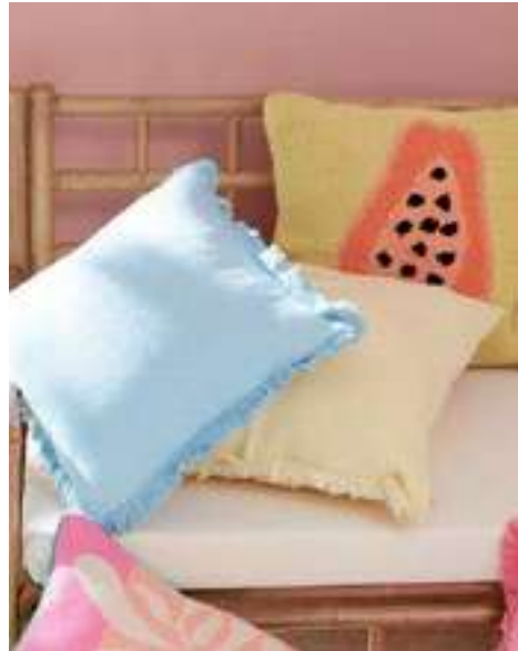
Pastelkleurige kussens zorgen voor een fleurig geheel.