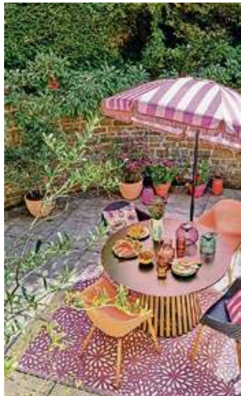
Mediterrane sferen in de tuin.

Wij presenteren drie verfrissende stijltrends waarmee je je tuin of balkon kunt omtoveren tot je ultieme toevluchtsoord. Of je nu houdt van luxe en minimalisme, een landelijke sfeer of juist een kleurexplosie; laat je hier alvast