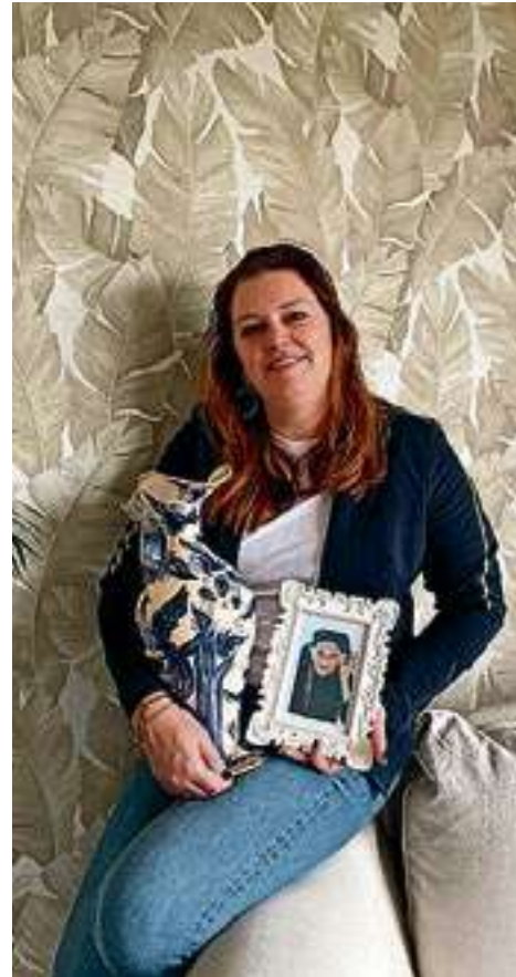
Liefde voor oude mensen en oude spullen.