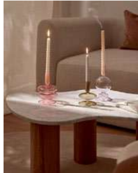
Mix & match er op los met verschillende materialen en patronen en geef je interieur een vrolijke boost.