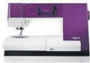
pfaff expression 710

Deze dagen extra korting op de naai,- en lockmachines + goodiebag