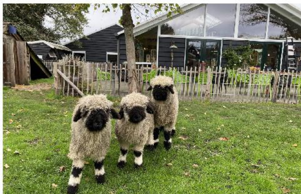
De Walliser Zwartneuzen op de Maargies Hoeve.

theeschenkerij wordt gerenoveerd, is zij van 6 t/m 10 maart gesloten. De boerderij en de boerderijwinkel (behalve op maandag) zijn wel gewoon geopend.