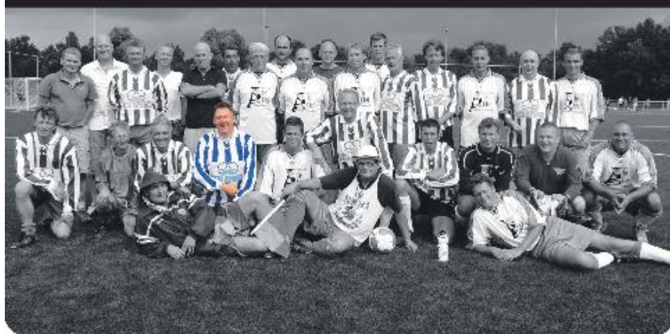
Teamfoto: OV-Magic Six

Het kleine mannetje werd met liefde over het hek gezet. Het kleine loopfietsje volgde en zo werd de weg over het kunstgrasveld richting de kantine van de Boys ingezet. Om opa een beetje op te draaien maakte ik de opmerking dat dat eigenlijk niet kon. "Hij wel", was het simpele antwoord, gevolgd door een lach.