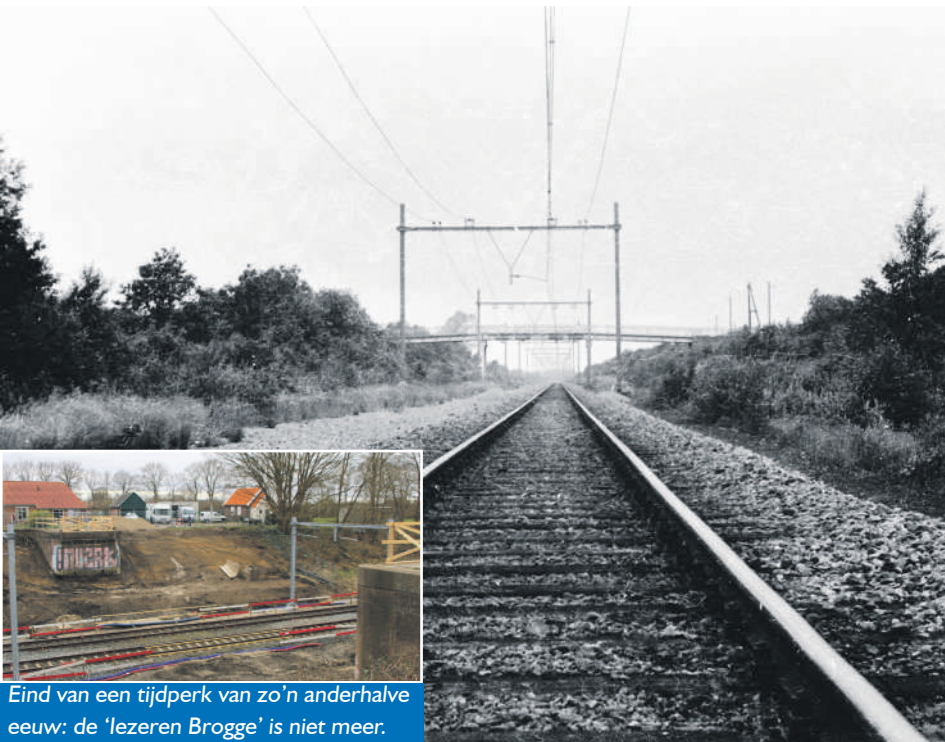
Eind van een tijdperk van zo'n anderhalve eeuw: de 'Ijzeren Brogge' is niet meer.

De bouw van de nieuwe spoorbrug heeft geen gevolgen voor het treinverkeer. Voor de omwonenden treedt wel hinder op, omdat niet alleen overdag maar ook gedurende een aantal nachten wordt gewerkt om de nieuwe brug zo snel mogelijk te realiseren. Overigens een leuk weetje: voor de IJzeren Brug tussen Witte Paarden en Baars over het spoor werd bij de bouw anderhalve eeuw geleden een sterkteberekening toegepast die inhield dat de brug een colonne soldaten met volle bepakking aan moest kunnen. De brug was niet alleen geliefd decor voor huwelijksfoto's, ook droeg een voetbalclub haar naam: A.D.IJ: Achter De IJzeren Brug, of beter: Achter De IJzeren Brogge.