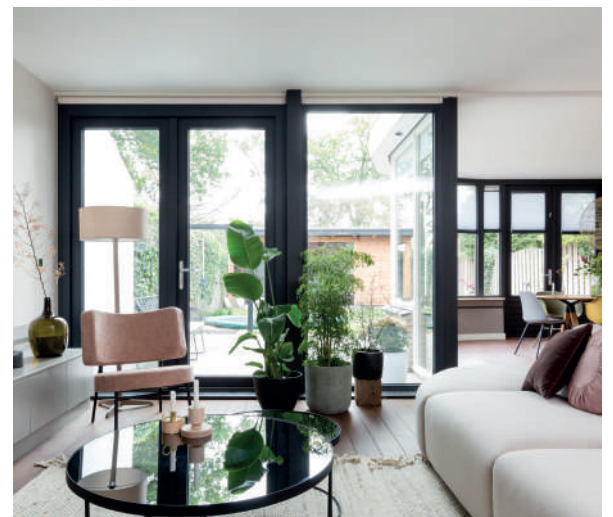
Deuren & meer...