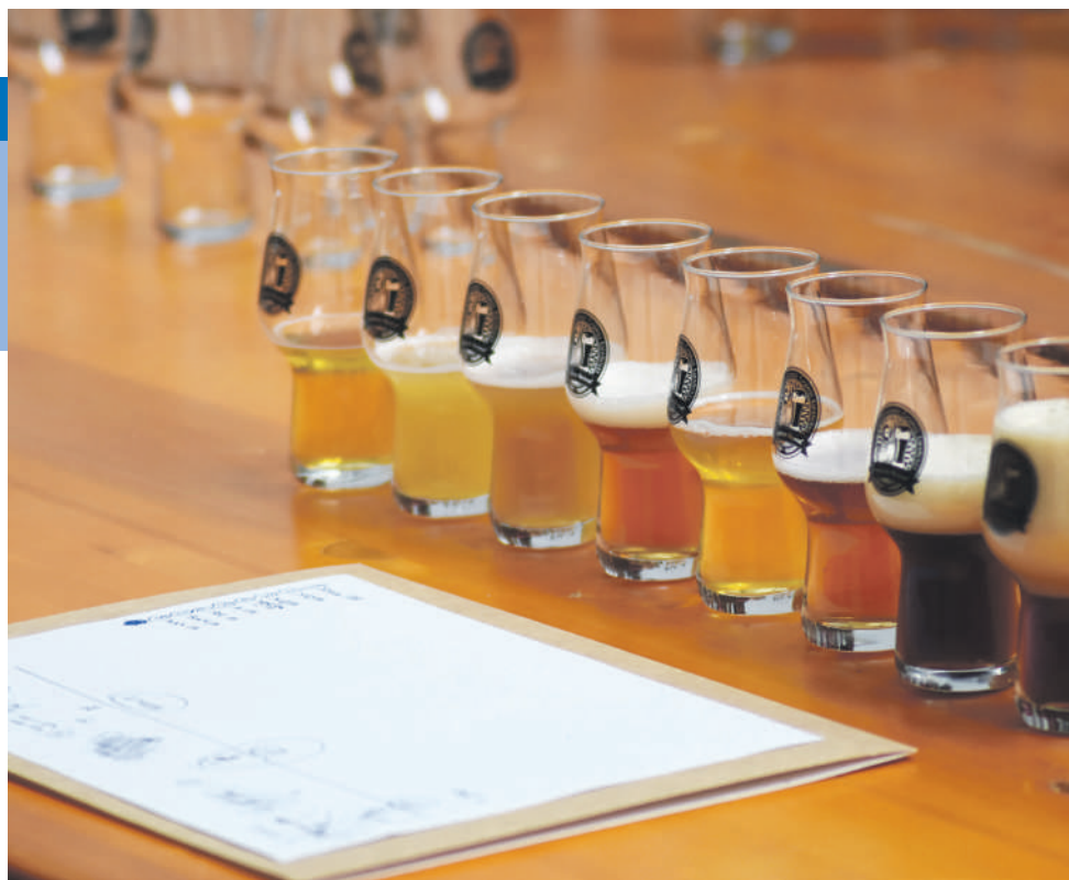
Een bierproeverij thuis is een populair uitje in coronatijd.

Van alle boekingen die 1001 activiteiten momenteel binnenkrijgt, is 95%