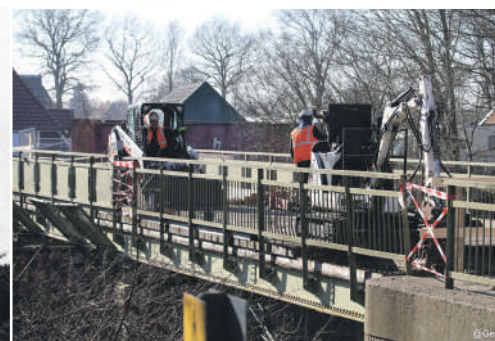
Voorbereidingen om de brug te demonteren.

De fotograaf stond eind jaren zestig midden tussen de rails om deze foto van de brug te maken.