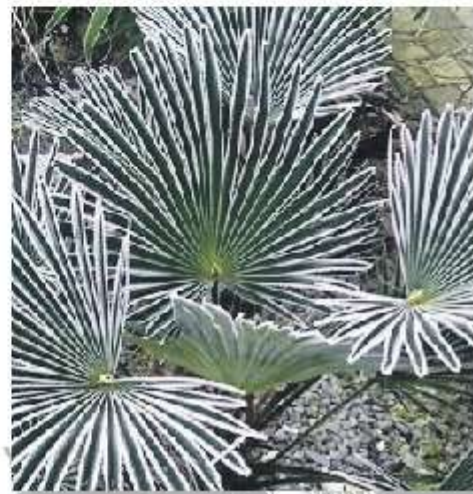
Bij vorst worden randen van de bladeren van de Trachycarpus wagnerianus veelal wit

soorten palmzaailingen geboren. "Tijdens het reizen is duidelijk geworden dat ik een exotische bomenfreak ben. Dat wilde ik toch enigszins vasthouden", vertelt Riphagen.