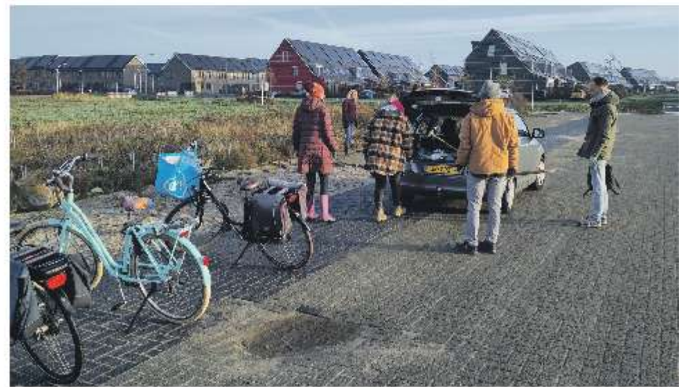
Vrijwilligers bezig bij de Wijkwekerij.

kan nog wel meer bomen gebruiken. Daar zijn we nu volop mee bezig. En dan wordt uiteindelijk een groot bos aangeplant met inheemse, niet-inheemse en voedselbomen." In november is de Wijkwekerij de Verbinding in Stadshagen geopend, met hulp van de provincie en de gemeente Zwolle. Deze verzamelplek van jonge bomen langs de Oude Wetering/Moutmolenstraat, nabij Kindcentrum de Paperclip, dient als het voorportaal naar het Stadshagerbos. Er staan boompjes van 30 tot 70 centimeter groot die afkomstig zijn uit de bosopslag bij het Westerveldsebos in Zwolle. Ze zijn tijdelijk dicht op elkaar geplant en komen straks in het bos volledig tot hun recht. "Met deze Wijkwekerij is een nieuwe stap gezet om een droom te laten uitkomen. Het doel is om daar uiteindelijk 15.000 boompjes te kweken. Ook kweken mensen zelf boompjes op in hun tuin met onze zaden. De kwekerij kan blijven bestaan tot dat de bomen naar