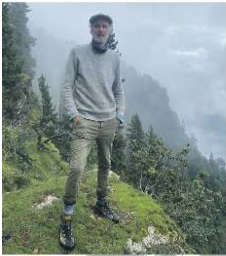
Zaden winnen van palmen op 2700m hoogte

De baderen vergelen minder snel en hoeven daardoor dus ook minder snel afgeknipt te worden. Dit zorgt voor een mooie compacte opbouw. Dit zorgt voor een mooie compacte opbouw. Het is wel een minder snelle groeier wat hem iets duurder maakt dan de fortunei . In 2001 zijn er in Engeland de eerste bomen die zaad geven en Riphagen hoeft dus niet jaarlijks meer naar Japan of Korea om daar zaad te halen.