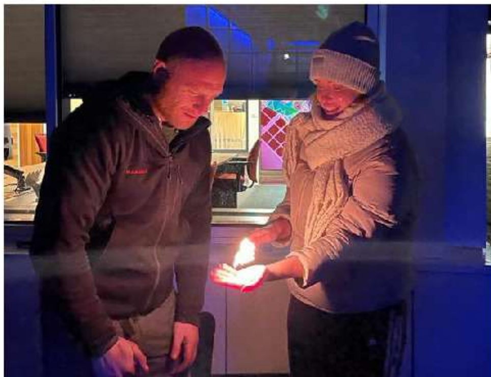
Heel diverse sessies, geregeld door Steunpunt Mantelzorg.

Niet alleen neemt de druk op formele zorg toe, óók die op mantelzorgers. En die zal nog groter worden door onder andere de vergrijzing en het langer thuiswonen van ouderen. "Iedereen krijgt wel een keer de gedachte dat er misschien een moment komt dat je die zorg nodig hebt óf zelf mantelzorger wordt. Maar het kan dus al op jonge leeftijd zijn dat dat laatste gebeurt. En ik merk dat er veel druk staat op die kinderen. Het is helemaal niet erg om bijvoorbeeld een keer boodschappen te doen voor je vader of moeder maar het moet niet jouw verantwoordelijkheid