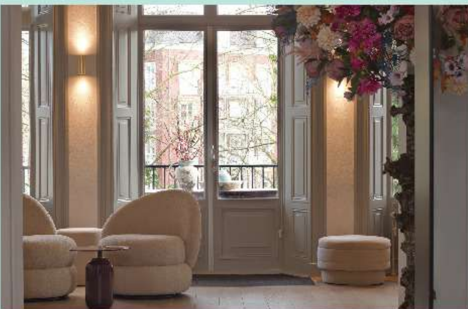
De sfeervolle en uitnodigende lounge van House of Joy & Health.

In Zwolle gaat Joy & Health ook inhoud geven aan een nieuw onderdeel van het bedrijf. Een ruimte op de eerste verdieping van het pand in hartje Zwolle biedt plaats aan een opleidingsinstituut voor meerdere doelgroepen. Vooral voor huidverzorging, maar daarnaast voor ondernemers in het algemeen en in de schoonheidsbranche in het bijzonder. www.houseofjoyandhealth.com