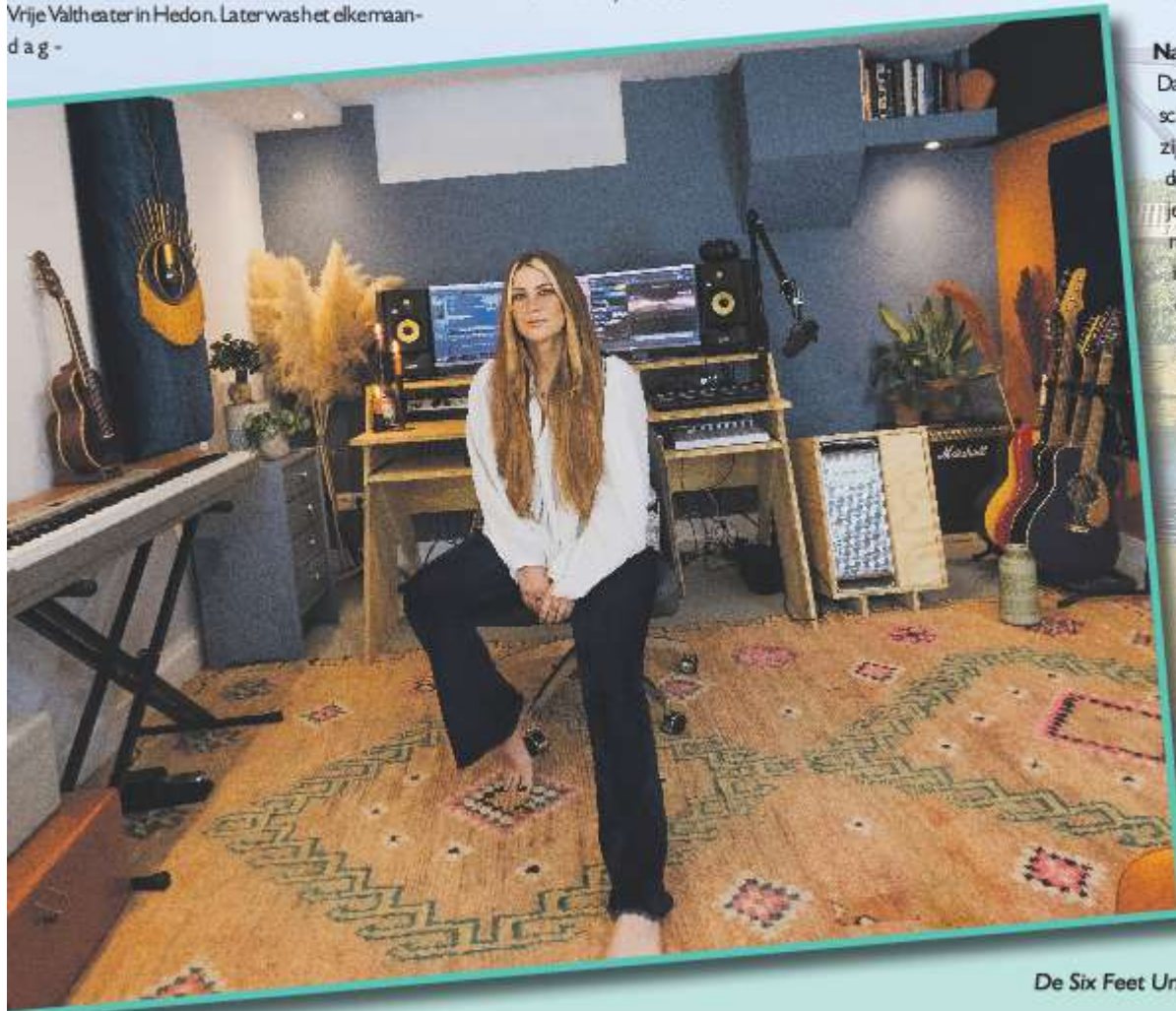
De Six Feet Under Studio, anno 2020.

Bij Delain was de Zwolse naast zangeres verantwoordelijk voor alle songteksten. Maar dat was niet haar enige aandeel. “Geen idee waarom dat soms gedacht wordt. Dat was ramelijk alleen bij de eerste plaat zo, waarbij Martijn de muziek grotendeels al klaar had. Daarna hebben we van het gros van de nummers de muziek met zijn drieën geschreven waarbij veel kruisbestuiving plaatsvond. Wat ik ook de beste liedjes vind; je kunt muziek en zang niet echt los zien van elkaar. Een leuk voorbeeld volgt van hoe het er in het begin aan toe kon gaan als ze de muziek bij een tekst al in haar hoofd had. “Met alleen een klarinet kun je daar niet veel mee. Dus ging ik met de gitarist zitten en speelde hij mogelijk passende akkoorden: 'Deze?' 'Of toch deze?' Net zolang tot we de juiste gevonden hadden. Maar mijn capaciteit om zelf de muziek te schrijven en op te nemen zijn met de jaren gegroeid en nu draai ik dus de hele productie alleen. Er zijn trouwens een boel mensen die dat in hun eentje doen, zo exceptioneel is dat niet. En ik laat me ook inspireren door sounds en plug-ins en heb hier en daar samples gebruikt. Maar het op elkaar afbouwen van muzikale ideeën, dat was er bij deze liedjes dus niet bij.”