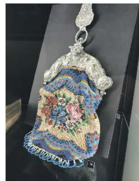
Antiek zilver.

Naarmate de avond vordert worden de gesprekken intenser en intiemer; ze zoeken de uitersten van elkaars