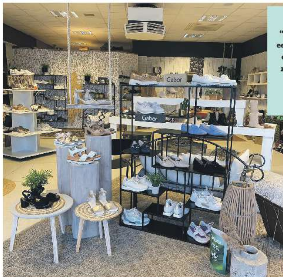
Zuss&Zij ziet er weer helemaal tip-top uit.

Al 6,5 jaar is de winkel hét adres voor modieuze en comfortabele schoenen en ook voor dit seizoen staat de winkel weer klaar met de nieuwste trends voor het voorjaar en de zomer. "Wij bieden een breed aanbod schoenen van verschillende merken, zoals Gabor, Rieker, Remonte, Helloform, Tamaris, Bullboxer en La Strada", vertelt Jacquellen. "Daarmee en met een goede prijs/kwaliteitverhouding kunnen we aan vrijwel iedere wens voldoen. In de aanloop naar het komende seizoen hebben we ook verschillende leuke sandalen waarop men comfortabel loopt in de warmere dagen. "Onze schoenen en sandalen met een uitneembaar voetbed bewijzen dat deze niet alleen comfortabel zijn maar ook modieus en handig als je steunzolen gebruikt", vertelt Jacquellen.