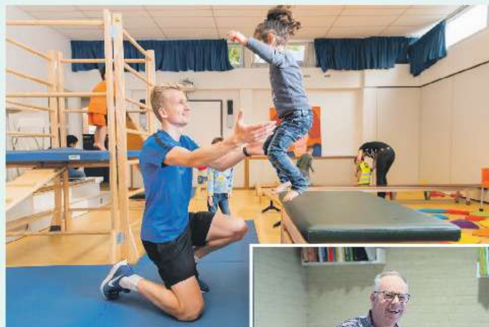
Gym waarbij je je veilig voelt.

Om reken- en taalvaardigheden op te doen, hoef je op de scholen van KindPunt ook niet altijd oefeningen in een schrift te maken. Voor een deel kan dat ook spelenderwijs. "Zo kwam een van de juffen van groep 3 op het idee om op vrijdag, als de kinderen wat vermoeder zijn, van de leerstof een spel te maken. Voortaan gaan ze donderdags om de tafel om te bepalen welk spel ze op vrijdag gaan doen. De kinderen leren dan spelend, zijn bezig met zowel hun hoofd als het lichaam." Maar ook in het net geopende 'OntdekPunt' kunnen kinderen op allerlei manieren leren zonder dat ze zich daar bewust van zijn. Voor deze leerlingen is het spelen, maar ondertussen leren ze ontzettend veel. "Het ontdekpunt is een ruimte waarin de