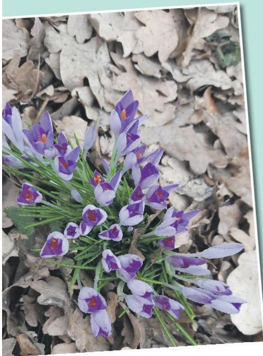
Maxine Overweel Stadsdichter Ommen