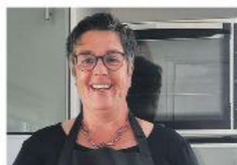
Nieuws uit de regio