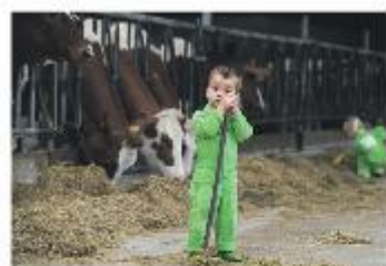
Kalverhouderij VOF- Groen