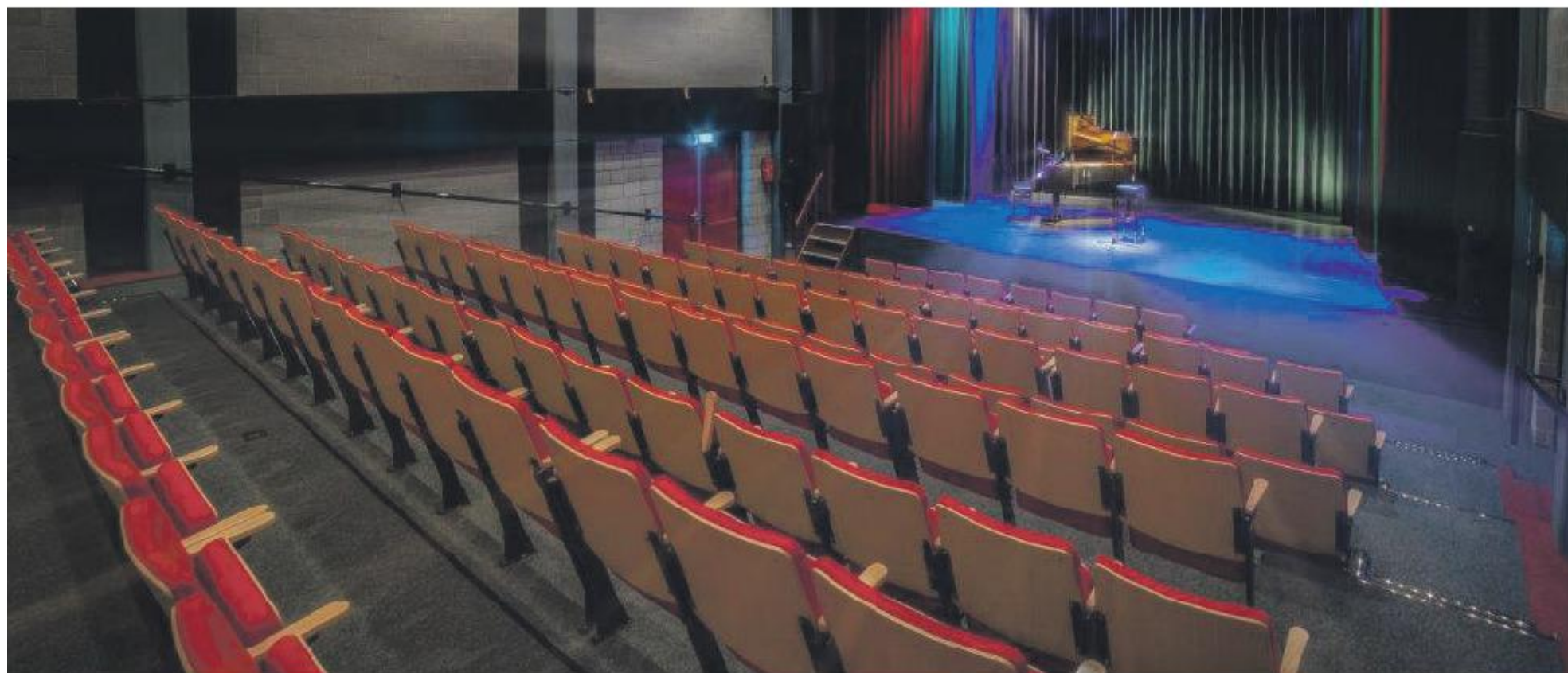
Fotografie: Theater de Carrousel.