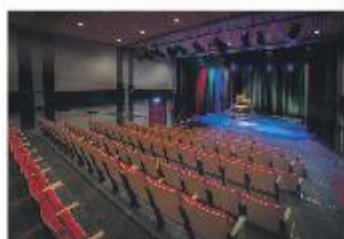
Theater de Carrousel biedt bijzonder aanbod