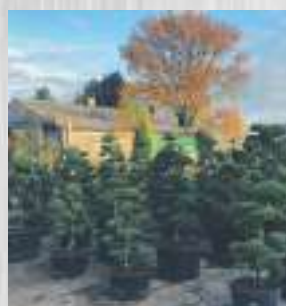
Vormsnoei / Tuin Bonsai

Dat geldt voor bijna alle planten. In de herfst is het minder warm en valt er meer regen dan in het voorjaar, je hoeft daarom minder water te geven. De grond is in de herfst nog wel vrij warm, de planten gaan zich voorbereiden op de winter en groeien ondergronds nog flink door.