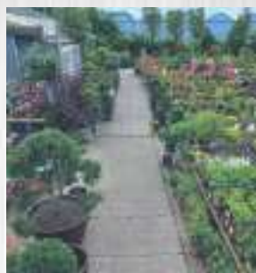
Bijzondere bomen en Heesters (Magnolia, taxus, naaldbomen enz.)