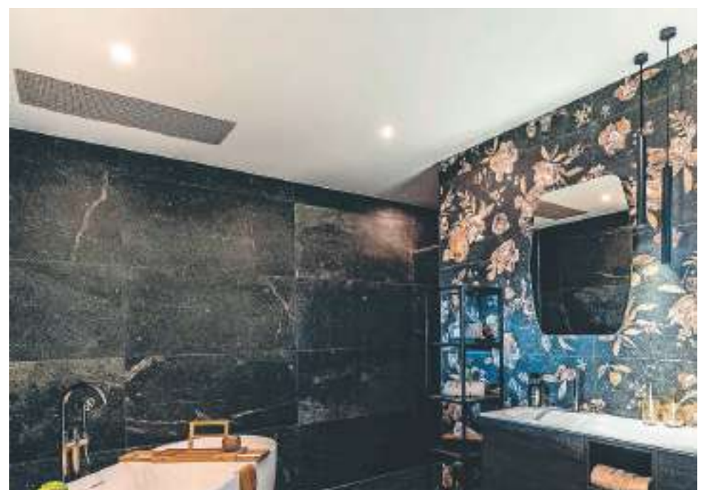
Een inblikje in de ruime showroom van Broekhuizen Keukens en Sanitair