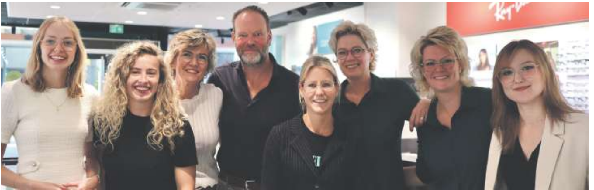
Een topteam in de winkels in Urk en Emmeloord.