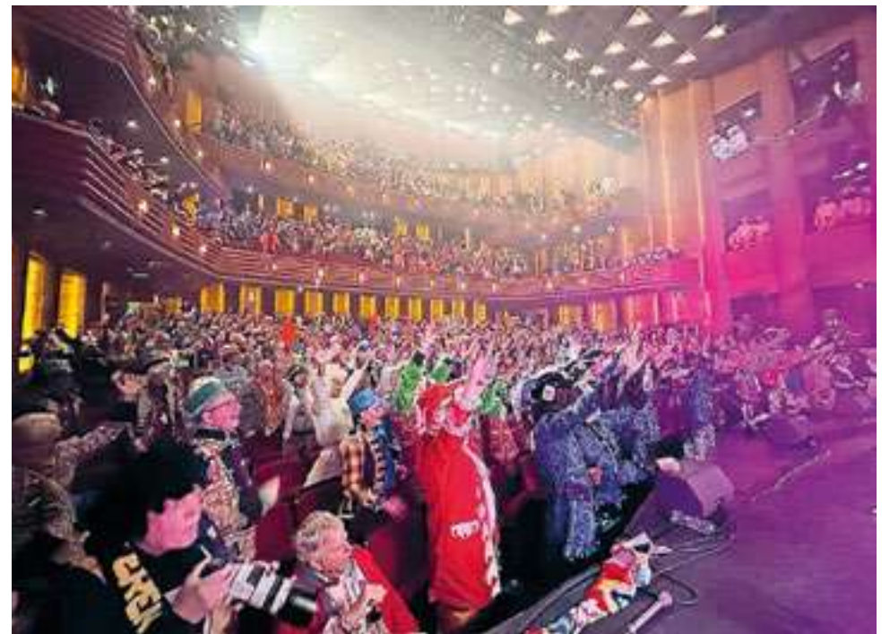
Ook het Sassendonks Carnavalsconcert in de Spiegel is altijd één groot feest.

te hossen om toch een leuke middag in Sassendonk te beleven. Daarbij je kleding aanpassen vanwege carnaval? Het mag maar het hoeft zeker niet. Het thema van de 48e Sassendonkse optocht: 'Sleppen en kleppen in Sassendonk'.