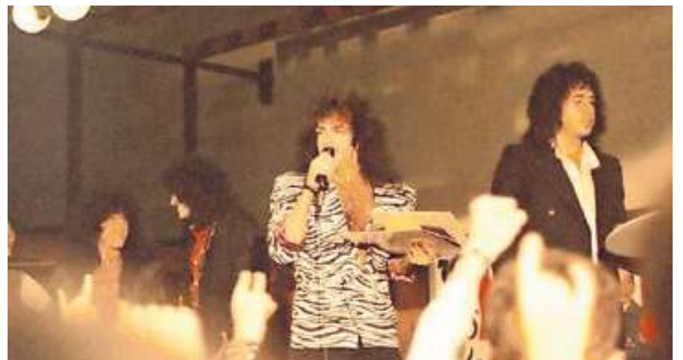
Kiss zonder de beroemde schmink in de bovenzaal van de IJsselhal. Daarna speelden de New Yorkers in de grote zaal beneden, waar ook zij de veemarkt nog geroken zullen hebben.

vraag in een muziekblad. En dat leverde taferelen op van tienermeisjes in typische hardrock-spijkerjacks vol padges die bijna gestrekt gaan als meneer Stanley of meneer Simmons een arm om hun schouders legt. Op Youtube is deze laatste te zien terwijl hij na het Zwolse concert in een limousine stapt, vergezeld door – hoe kan het ook anders – een jonge blondine. Op weg naar een hotel aan de Stationsweg misschien? Ondertussen is ook aan Kiss een einde gekomen: op 2 december jongstleden gaven de grootverdieners in New York City hun laatste concert, mét schmink op. Ook dat is nu bijna veertig jaar na hun optreden in de IJsselhal. Zwolse hardrockers konden jarenlang op de fiets naar hun grote helden, tegenwoordig is het met de trein of in de auto op naar Eindhoven.