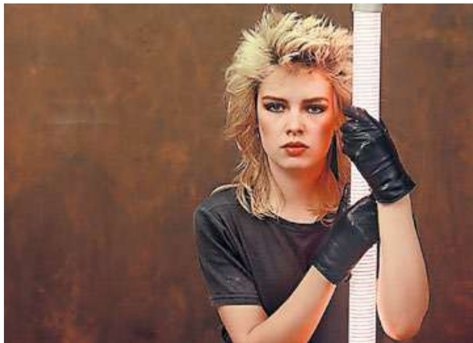
In de jaren tachtig een new wave icoon en sekssymbool.

Kim Wilde, die meer dan 30 miljoen platen verkocht en in 1983 werd uitgeroepen tot beste Engelse zangeres, is ook nooit echt gestopt met zingen. Alleen in de jaren negentig leek het er even op dat ze met haar carrière op haar laatste (welgevormde) benen liep. Maar dat bleek slechts een adempauze: al snel kwam Kim daarna weer op stoom. In 2019 deed Kim nog een