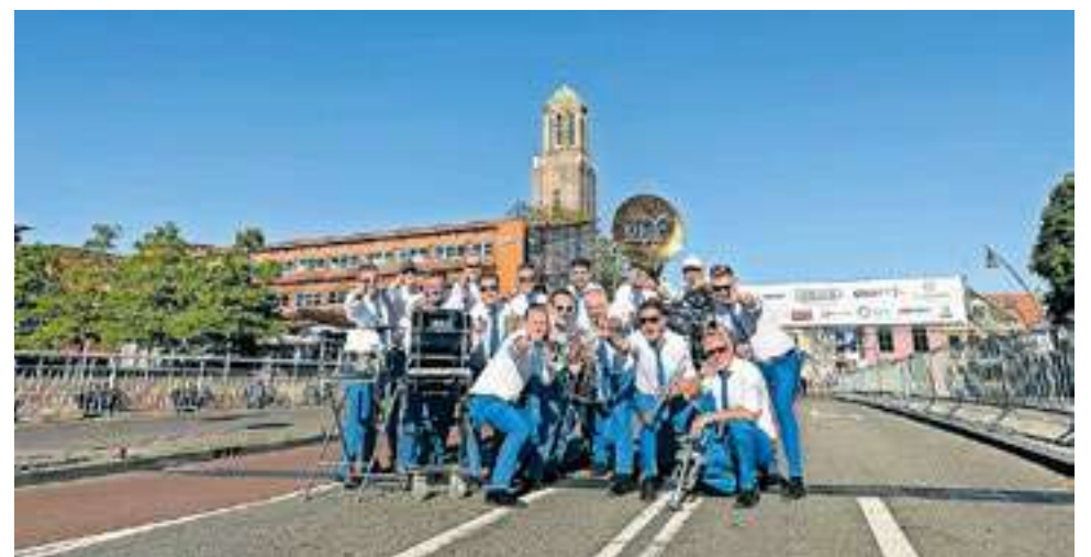
Evenementenband 103 dB is erbij tijdens het Seniorencarnaval op 2 februari in Lumen.