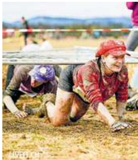
Zeker de survivalrun van 9 kilometer kan een zware kluit worden.

Kijk voor meer informatie over onder andere de verschillende klasseringen, benodigde kleding en starttijden op thorrun.nl .