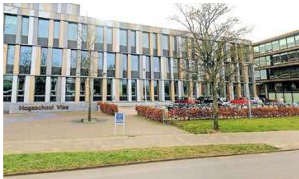
Op de open dag zijn ook proeflessen te volgen.

Aanmelden op www.viaa.nl/evenement/open-dag-31-januari-2024 .