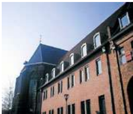
Proef de sfeer van het studeren aan het conservatorium in Zwolle.

De hoofdvakken mandoline, viool en compositie Klassieke Muziek