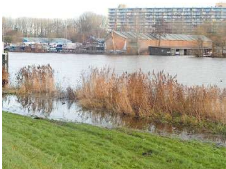
Zicht vanaf de Hasselterdijk op het Zwarte Water ter hoogte van de Palestrinalaan in Holtenbroek. Nu is de Zwarte Waterzone een gebied met onder andere verouderde jachthavens. Als het aan de gemeente ligt komen er woningen en 'andere ontwikkelingen'.

Het Zwolse college van burgemeester en wethouders gaf in oktober na vragen uit de gemeenteraad aan dat de bedoeling blijft om dit hele gebied aantrekkelijker en toegankelijker te maken voor inwoners. Daarnaast blijft het een potentiële ontwikkellocatie voor woningbouw en andere ontwikkelingen. Met de ontwikkeling van de Zwarte Waterzone wordt het gebied met de verouderde en vervuilde industrie- en recreatiehavens aan de groene rand van Holtenbroek een plek 'waar iedereen kan wonen, werken en recreëren'. 'Omdat het gebied buiten de dijk ligt, wordt het bovendien een bijzonder voorbeeld van bouwen en inrichten op een manier die past bij de veranderingen van het klimaat en de invloeden van het water.' Het college vindt het belangrijk dat omwonenden en andere betrokkenen opnieuw worden meegenomen in het vervolgproces. Maar: 'Initiatiefnemers zijn zelf verantwoordelijk voor participatie. Afhankelijk van de alternatieven die worden onderzocht, zal de gemeente hierin een meer sturende rol nemen.'