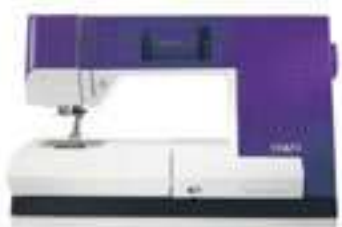
Expression 710 van Pfaff

Wij helpen u graag om de juiste keuze te maken en bieden ook workshops op deze machines aan, zie onze website.