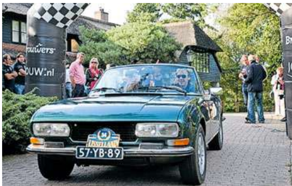
Oude auto's, mooie locaties.

Er is voor elk wat wils, van beginners tot meer ervaren rijders: inschrijven is mogelijk in de Sport-, Club- of Open klasse via www.ijssellandrally.nl .