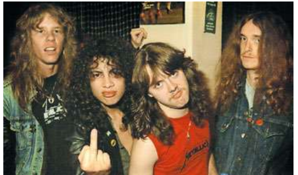
Metallica in 1984. Toen nog slungelige jochies, nu miljonairs.

De IJsselhallen kunnen niet alleen trots zijn op dit eerste Nederlandse optreden van Metallica. Naast bekende buitenlandse popacts (UB40, Level42 en Dire Straits bijvoorbeeld) wisten de hallen opvallend veel grote metalbands naar Zwolle te krijgen. Optredens van onder anderen Kiss, Saxon, Iron Maiden, Motörhead, Dio, Megadeth en Testament zorgden ervoor dat Zwolle landelijk de reputatie kreeg van metalstad. Een eer die nu naar Eindhoven gaat. De IJsselhallen krijgen straks een andere bestemming en het laatste wapenfeit op rockgebied zal dan het concert