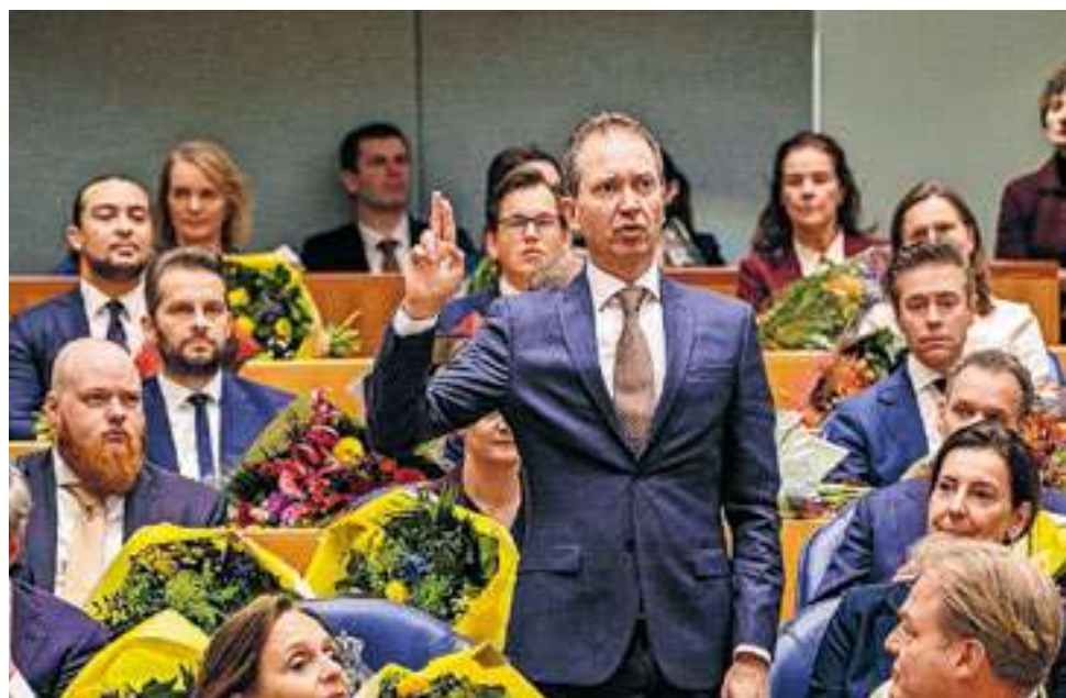
Het kersverse Tweede Kamerlid legt de eed af te midden van zijn partijgenoten van Nieuw Sociaal Contract. Rechts onder op de foto kijkt Pieter Omtzigt goedkeurend achterom.

opkomen voor de mensen en voor de regio. En ook uit alle 2500 brieven van mensen die kandidaat-Kamerlid voor NSC wilden worden, blijkt die wil om het anders te doen. Dat heeft me overgehaald om toch weer de politiek in te gaan. Meebouwen aan NSC leek me wel echt de moeite waard. Toen ik twintig jaar geleden voor het CDA in de Kamer kwam, was dat niet gepland. Ik was toen lid van de Zwolse raad en werd gevraagd voor de 'staartlijst'. Maar ik werd toch gekozen. Nu is dat anders, ik stond op de zesde plaats en vanaf morgen voer ik met Pieter de onderhandelingen over een nieuw kabinet op landgoed De Zwaluwenberg, mede vanwege mijn betrokkenheid bij het programma en kennis over de financiën."