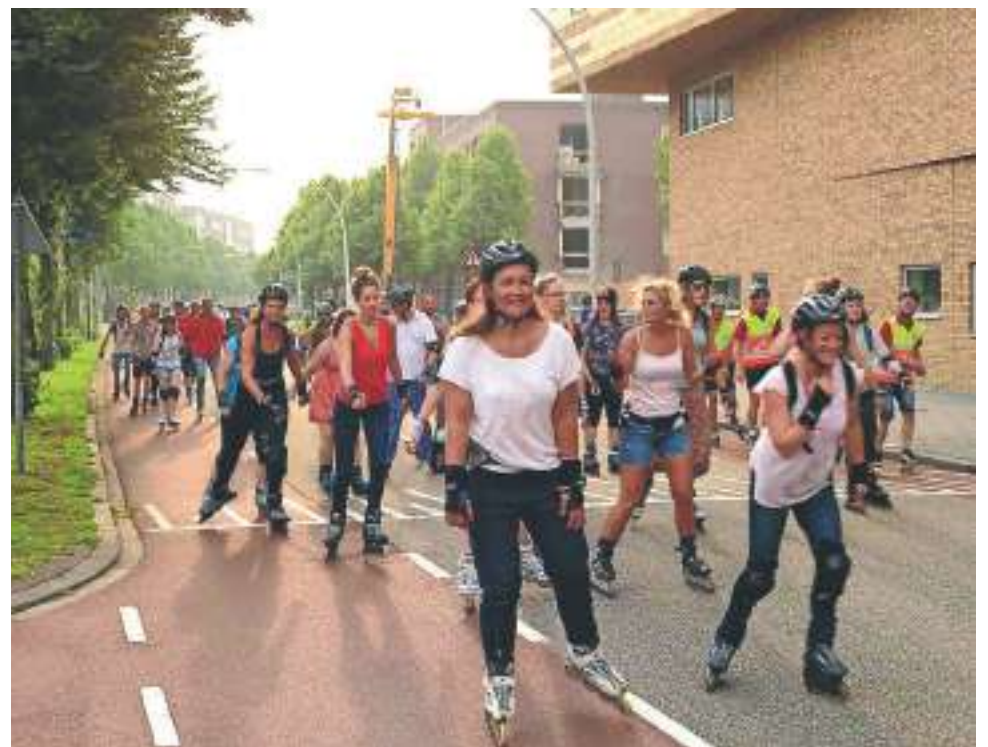
Dit jaar de laatste keer georganiseerd skaten met Zwolle als decor.

Houd het weerbericht dus goed in de gaten en ook de Facebookpagina www.facebook.com/nightskatezwolle en de website