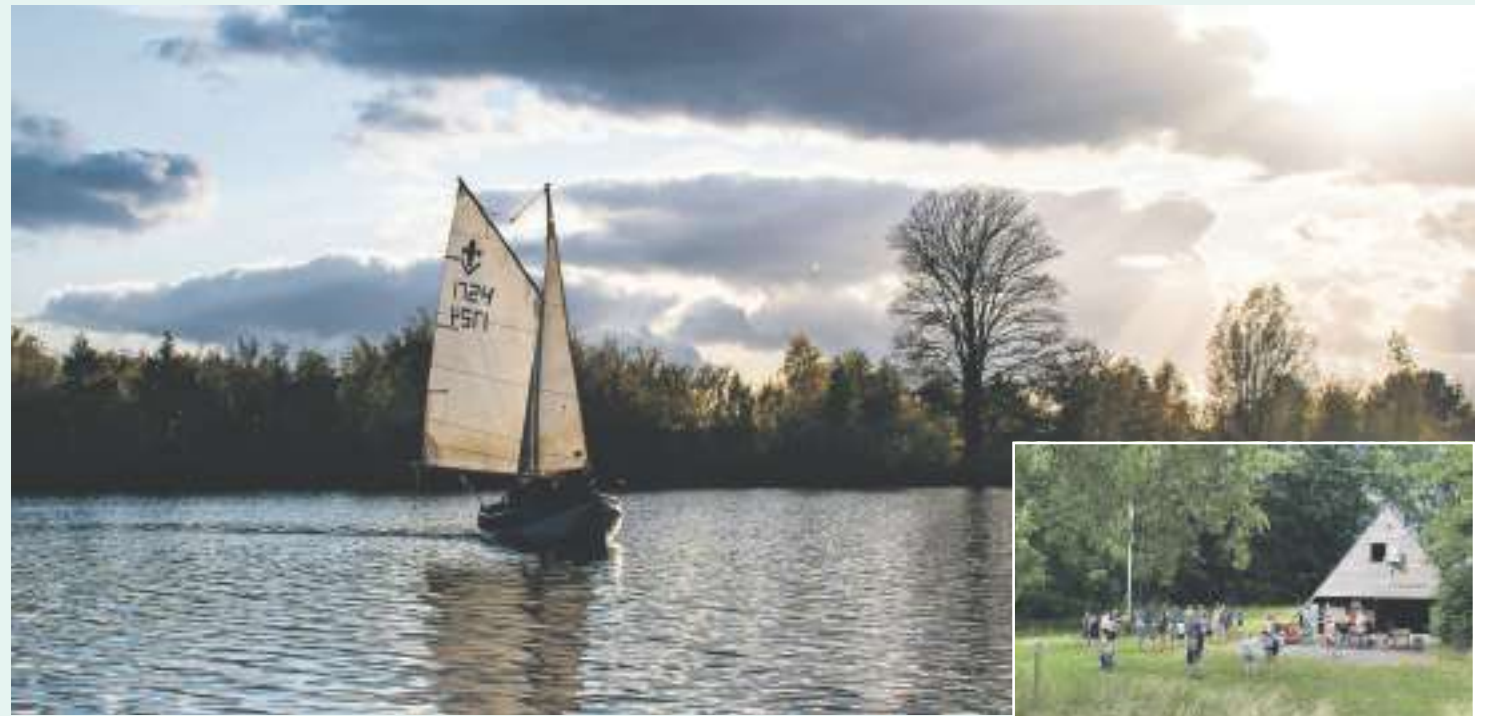
Ouders van leden kwamen een kijkje nemen op zaterdag 24 juni.

Bij de vereniging draait alles om boten en het