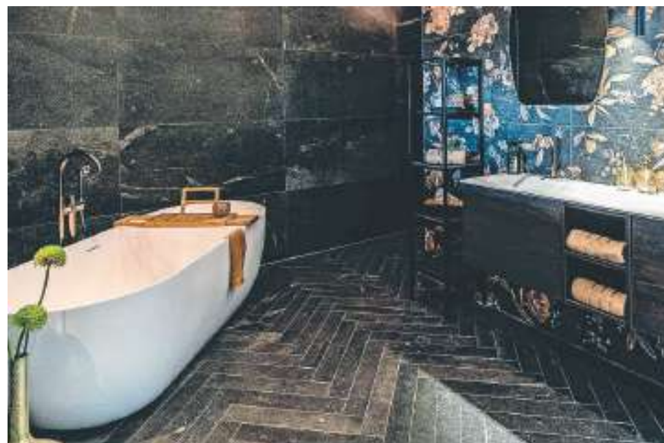
Een inblikje in de ruime showroom van Broekhuizen Keukens en Sanitair